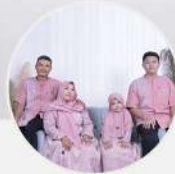
BUNDA DECHA Ibu Rumah Tangga

Kualitas bahan sangat bagus dan nyaman dipakai, dengan Desain yang Uptodate, Sangat Rekomended untuk dijadikan Seragaman atau couple untuk berbagai Acara