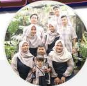
IBU EKA Pengajar Profesional

Selalu puas dengan model 2 sarimbit mutif. Memang top 🥰👍