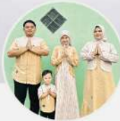
IBU ASTRY Ibu Rumah Tangga

Desain kekinian, kualitas bahan sangat bagus, nyaman dipakai. Rekomendasi seragaman pilihan keluarga 🙌👍