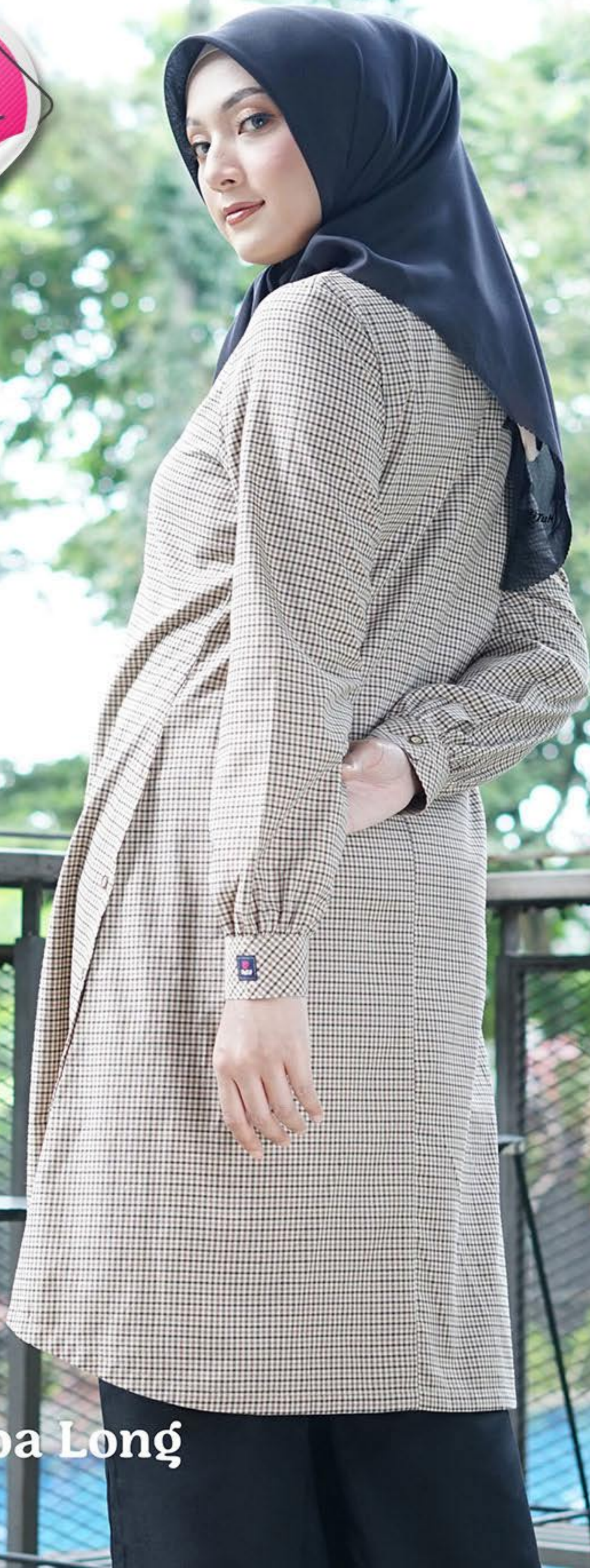
Salsaba Long Brown Tapenade