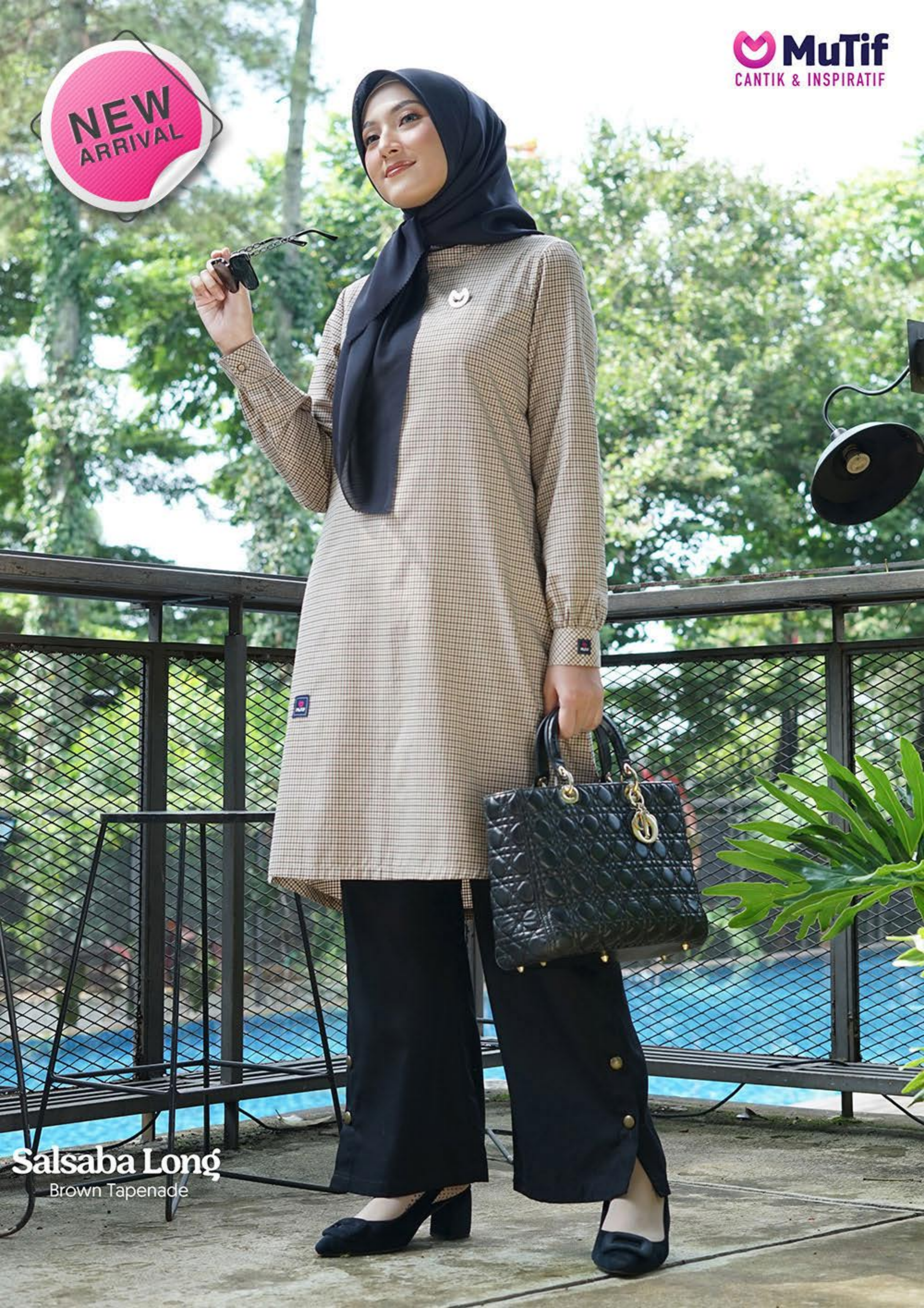
Salsaba Long Brown Tapenade